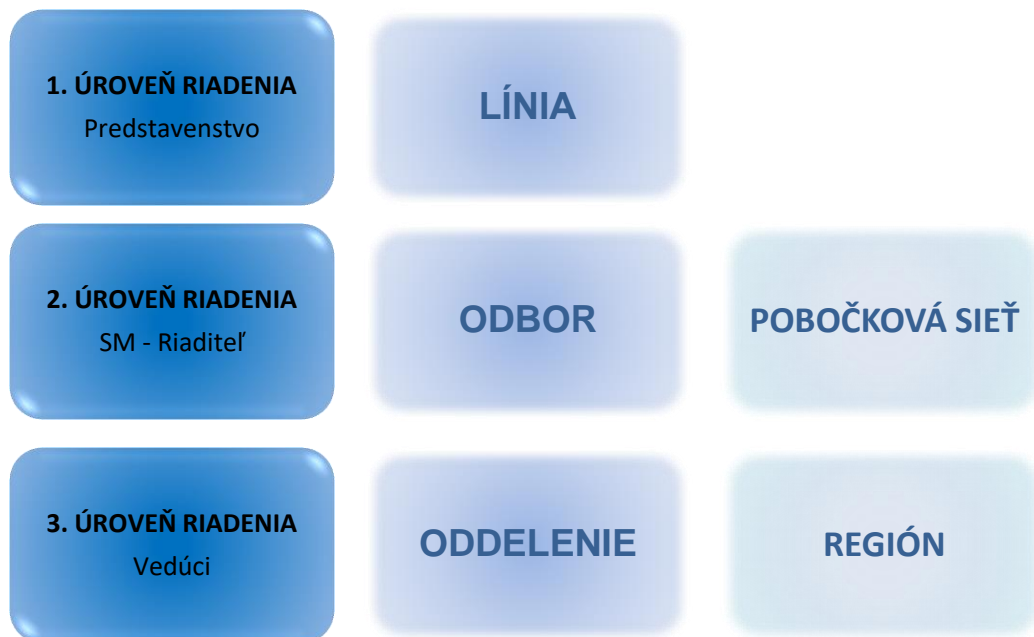
Schéma organizačnej štruktúry banky

Zverejňovanie informácií podľa opatrenia NBS č. 16/2014 o uverejňovaní informácií bankami a pobočkami zahraničných bánk v znení zmien a doplnení podľa opatrenia NBS č. 13/2015 a podľa opatrenia NBS č. 15/2018 a v súlade s nariadením Európskeho parlamentu a Rady EÚ č. 575/2013 k 31. marcu 2021